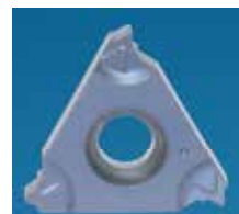
Typ B = lisovaný utvařeč třísek

BLU = PVD tří-vrstvý povlak, jemnozrný substrát pro nerezové oceli, litiny, slitiny titanu, slitiny hliníku a žáruvzdorné slitiny