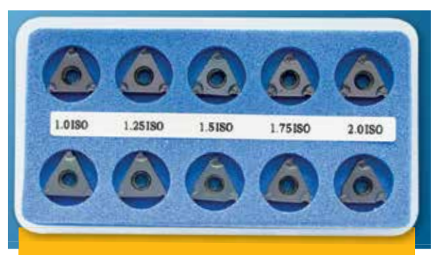
A-KEMB (BMA nebo BLU) SADA ISO VNĚJŠÍCH DESTIČEK