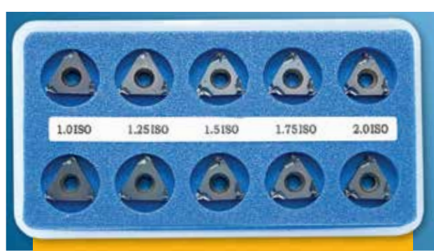
A-KIMB (BMA nebo BLU) SADA ISO VNITŘNÍCH DESTIČEK