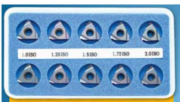
A-KIM (BMA, BLU nebo HBA) SADA ISO VNITŘNÍCH DESTIČEK