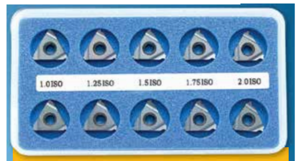
A-KEM (BMA, BLU nebo HBA) SADA ISO VNĚJŠÍCH DESTIČEK