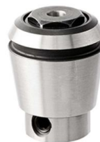
S délkovou kompenzací

Tato akce platí do 30.6.2021 nebo do vyprodání zásob.