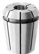
Utěsněné nebo s chladicími kanálky